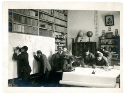
'Missie à la carte - 2019